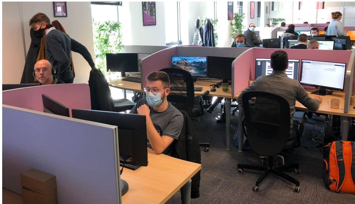
Le groupe Infodis a implanté un centre de services sur l'un des plateaux du bâtiment d'entreprises Terralia, rue de la Vallée, où cinquante personnes (techniciens de support, conseillers, etc.), embauchés directement en CDI, sont à pied d'œuvre depuis l'an dernier.